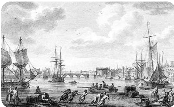
Port de Dieppe, vue depuis le Grand Quai