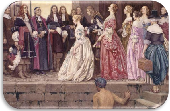
Arrivée de Fille du roi