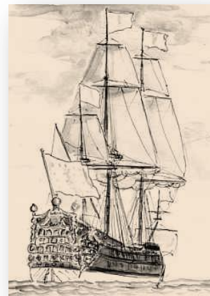
Navire le St-Louis