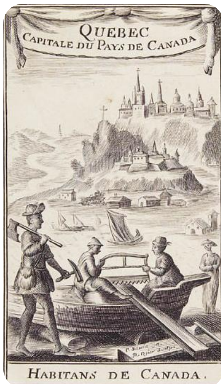
Charpentiers de navires